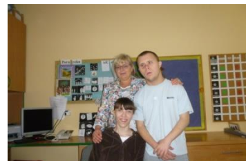
zespół edukacyjny w Gimnazjum