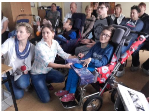
Rodzice nie tylko poznali sposoby

W dalszym ciągu budzimy u uczniów zainteresowanie książką i czytelnictwem.